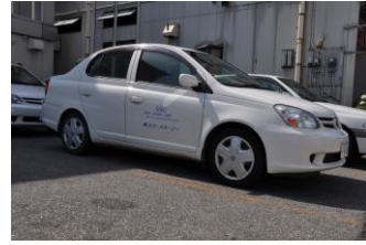
弊社のパトロールカーです